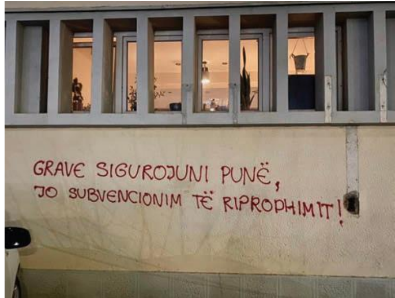
تصویر شماره ۶. گرافیتی ای در گلوگوواس: «باید برای زنان کار فراهم کرد نه اینکه به آنها برای تولید مثل یارانه داد.»