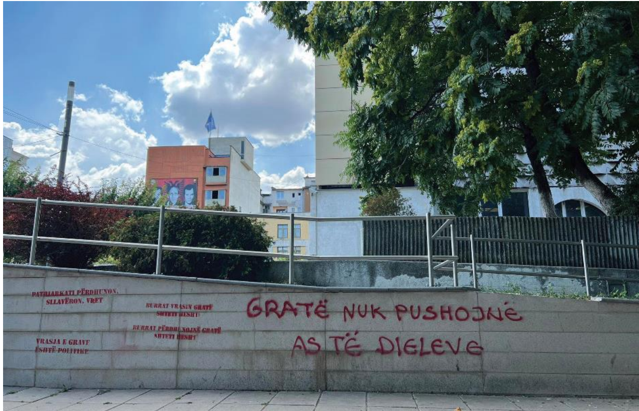
تصویر شماره ۲. گرافیتی ای در پریشینا با نوشته: «زنان حتی در روزهای یکشنبه هم استراحت نمی کنند». ۲۷ آپریل ۲۰۲۲.