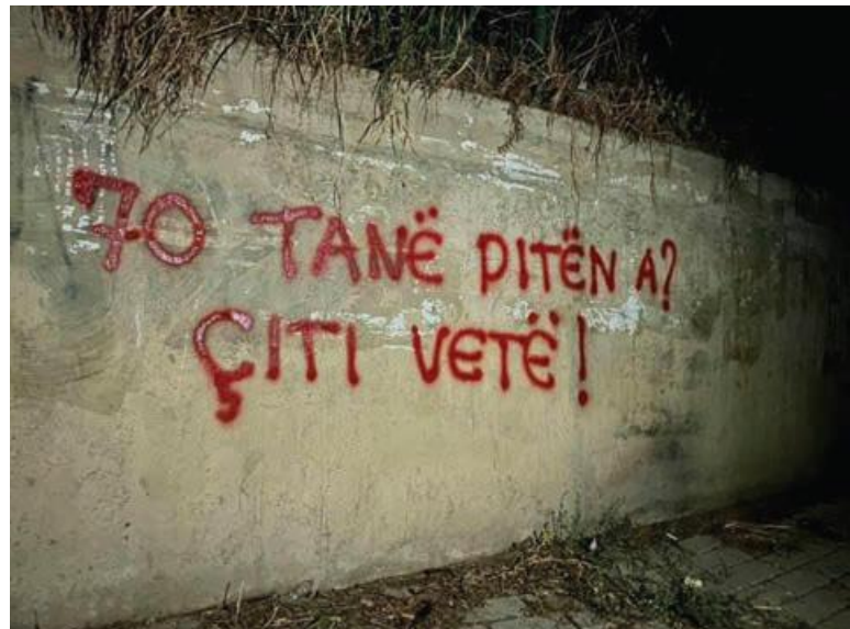
تصویر شماره ۳. گرافیتی ای در ووچیترن با نوشته: «۷۰ تا در روز، آره؟ خودت بریز!»