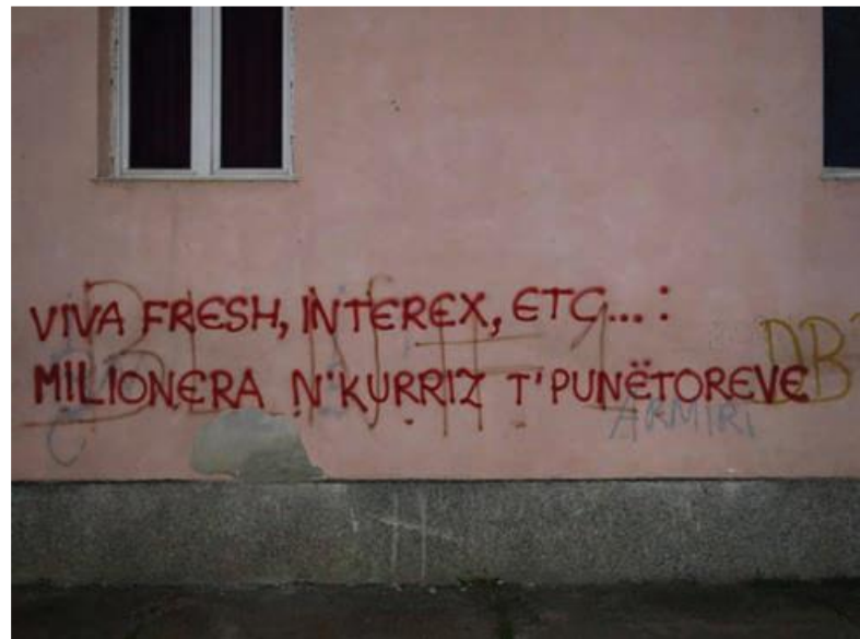
تصویر شماره ۷. گرافیتی ای در لیجان: «Viva Fresh, InterEX و غیره...: میلیونر شدن به بهای زیان کارگران.»